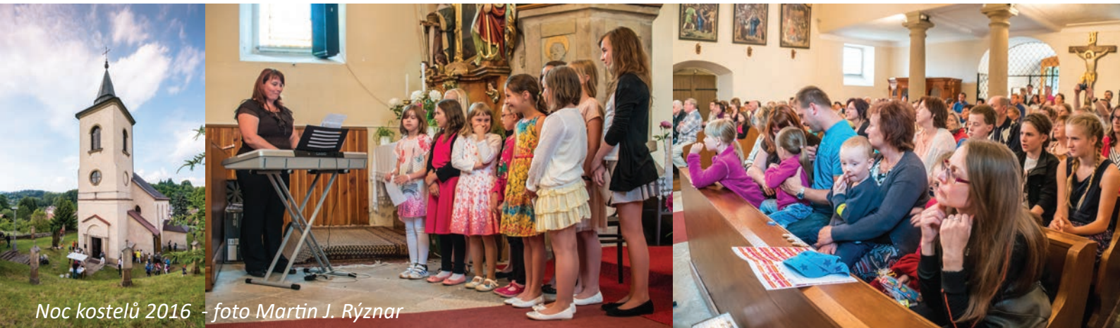
Noc kostelů 2016