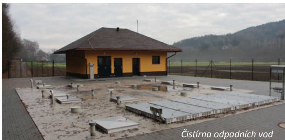
Čistírna odpadních vod