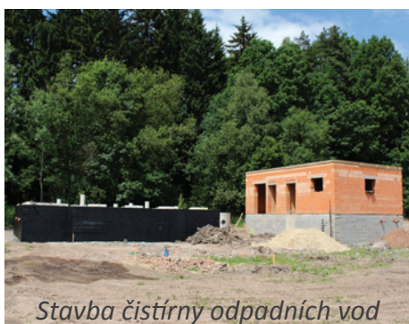
Stavba čistírny odpadních vod

K vlastnímu průběhu stavby: Dodavatel stavby firma Vakstav v současné době finišuje na propojení hlavního kanalizačního řádu, probíhá výstavba přečerpávacích jednotek, staví se hlavní čerpací stanice i vlastní čistírna odpadních vod v prostoru pod golfovým hřištěm.