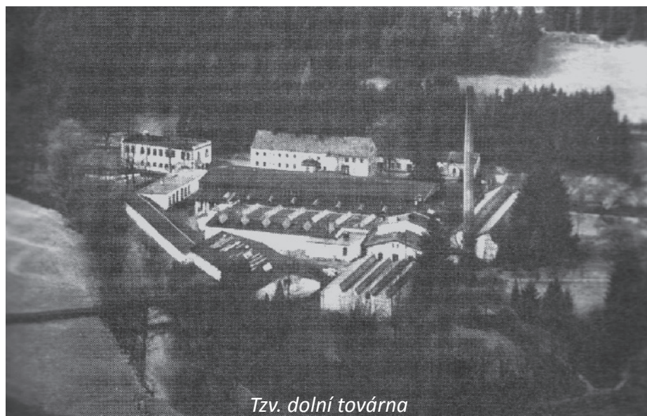
Tzv. dolní továrna